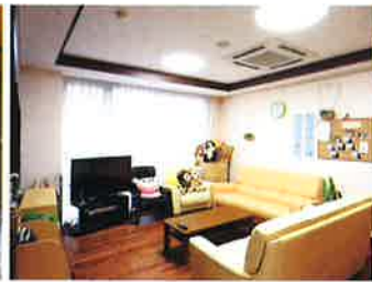
ユニット棟リビング