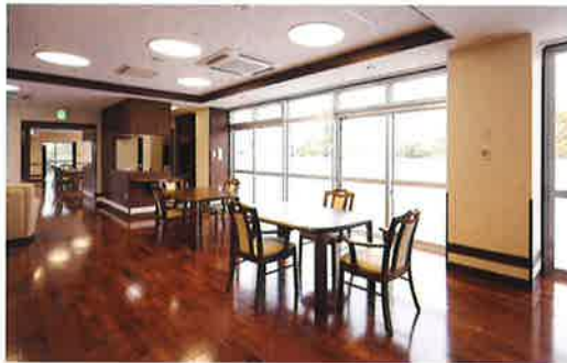
ユニット棟ダイニング